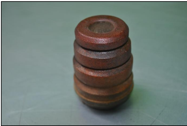
Detalle de un tope inferior con síntomas de degradación

De hecho, en las motos de serie las cargas de nitrógeno van al mínimo, y esto afecta directamente al tacto del amortiguador, haciéndolo blando, volviéndonos locos con unos reglajes que nunca acaban de funcionar bien.