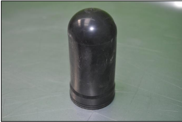
Detalle de un bladder deformado

pulmón de goma existente que separa la cámara de aceite de la cámara de nitrógeno) y el segmento del pistón.